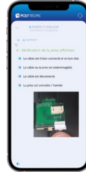
Foire aux questions, tutoriels vidéo, manuel technique