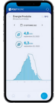
Quota autoproduction / consommation en temps réel (si installation photovoltaïque PolySolar)