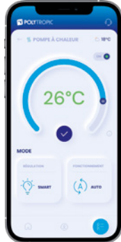
Règlage de la température de consigne, notification d'atteinte en température, message d'alerte