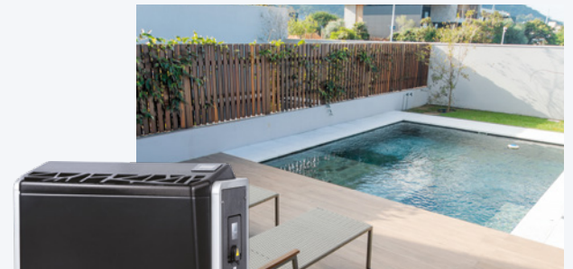
En ABS 70% recyclé noir mat

Le flux d'air et les ondes sonores sont dirigés vers le ciel