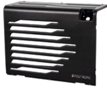
DE SERIE : DARK ABS 70% recyclé noir mat

Équipée de série avec la façade DARK ABS, la façade choisie en option est livrée montée :