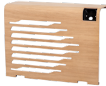
EN OPTION : WOOD Bois FSC issus de forêts gérées de façon durable. Brut - à lasurer.