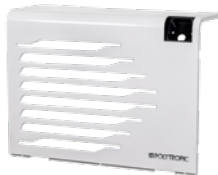
EN OPTION : CRISTAL Métal blanc brillant